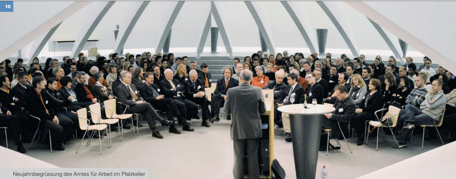
Neujahrsgruß des Amtes für Arbeit im Pfalz Keller

Gedrucktes und Gehörtes rund um den Arbeitsmarkt