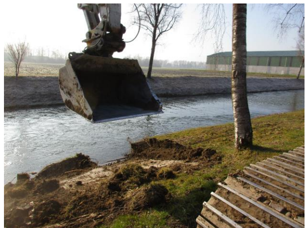
Entfernung von Böschungswülsten

Bei Unklarheit über das zu wählende Verfahren gibt das Amt für Natur, Jagd und Fischerei gerne Auskunft.