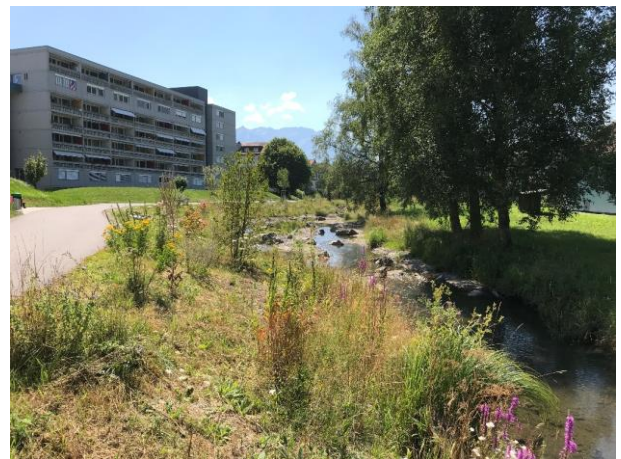
Ökologisch wertvolles Gewässer im Siedlungsgebiet mit unterhaltener Ufervegetation

Bei allen Eingriffen in die Gewässer sind die ökologischen Aspekte zu berücksichtigen. Es gilt: So wenig Eingriffe wie möglich, so viel wie nötig.