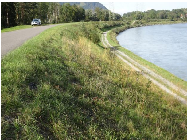
Schachbrettartiges Mähregime mit Erhalt einzelner Buschgruppen am Alpenrhein