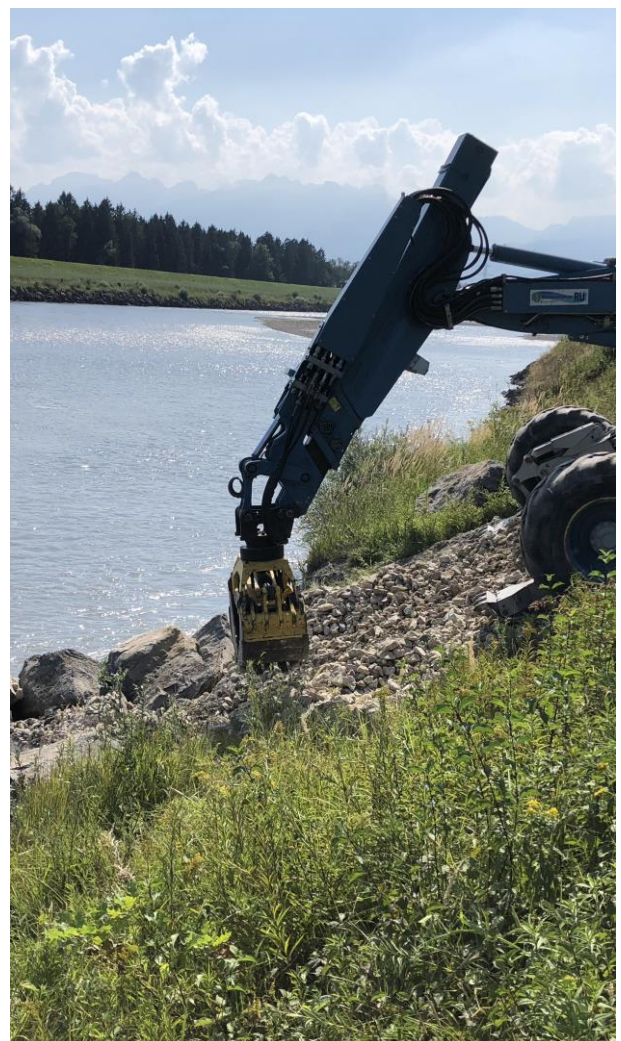
Arbeiten im Bereich des Rheinwuhrs

Bei Unklarheit über das zu wählende Verfahren gibt der kantonale Wasserbau gerne Auskunft.