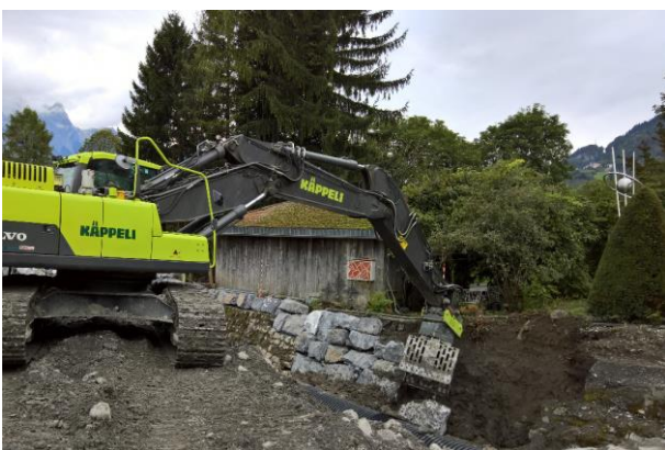
Ersatz einer Ufersicherung

Wenn Gefahr in Verzug ist, kann die kantonale Fachstelle eine Bewilligung zum vorzeitigen Baubeginn erteilen.