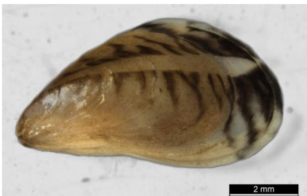
Abb. 1: Quagga-Muschel.

Sie kann eine Größe von bis zu 40 mm erreichen und wird etwa drei bis fünf Jahre alt. Das Alter eines Individuums lässt sich mithilfe von Altersringen bestimmen. Anhand der Größe ist dies nicht zuverlässig möglich. Das größte Wachstum wird im Frühjahr erreicht und ist abhängig von der Wassertemperatur, der Nahrungsverfügbarkeit, den Sauerstoffverhältnissen und der Strömung.