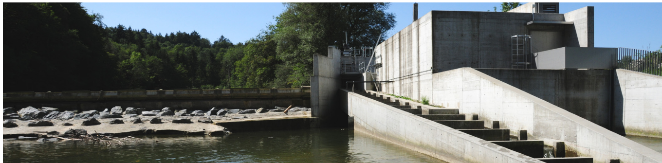
Fischtrappe beim Wehr Burentobel an der Sitter bei St.Gallen