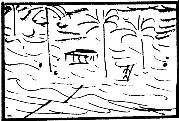
"Die Hard" Öl auf Leinwand 500.450cm 2019 courtesy of St.Gallen