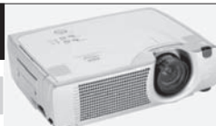
Daten-Videoprojektor (ab Fr. 1'200.-)

Gruebstr. 17 • 8706 Meilen • T: 044 - 923 51 57 • F: 044 - 923 17 36 www.av-media.ch (Online-Shop!) • E-Mail: info@av-media.ch