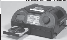
CD-Recorder mit Verstärker